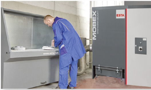
MOBEX angeschlossen an einen Absaugtisch

Die MOBEX-Baureihe ist in zwei Leistungsstufen erhältlich: Neben der Version mit 3-kW-Motor und zwei Filterpatronen ist auch eine Ausführung mit 4-kW-Motor und drei Filtereinheiten mit größerem Luftvolumenstrom erhältlich.