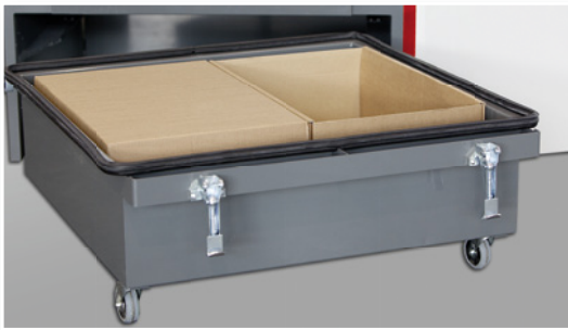
Die beiden 38Liter Staubsammelkartons in der fahrbaren Schublade

Integriert ist stets das bewährte ESTA Jet-Pulse-System, das die Filter während des Betriebs vollautomatisch durch Druckluftstöße reinigt. Abgeschiedene Stäube fallen nach unten – ebenso wie gröbere Partikel und Späne, die durch den integrierten Prallabscheider bereits bei Eintritt in das Entstaubergehäuse abgeschieden werden. Diese Konstruktion optimiert nicht nur die Luftführung, sondern trägt auch zur Verlängerung der Filterstandzeit und somit zu geringerem Druckluftverbrauch bei.