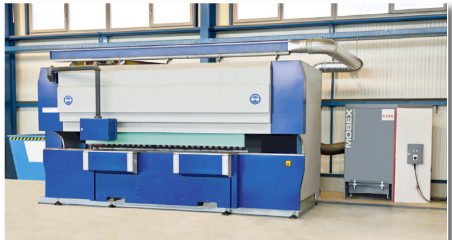
MOBEX an einer Fräsmaschine